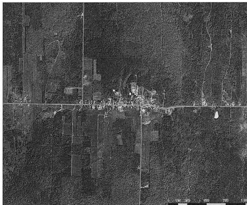
Annexe 2 – Zones susceptibles au phénomène d'îlot de chaleur

Le Plan d'urbanisme n° mai 1990 est modifié par l'ajout de l'annexe 2 intitulé « ZONES SUSCEPTIBLES AU PHÉNOMÈNE D'ÎLOT DE CHALEUR ».